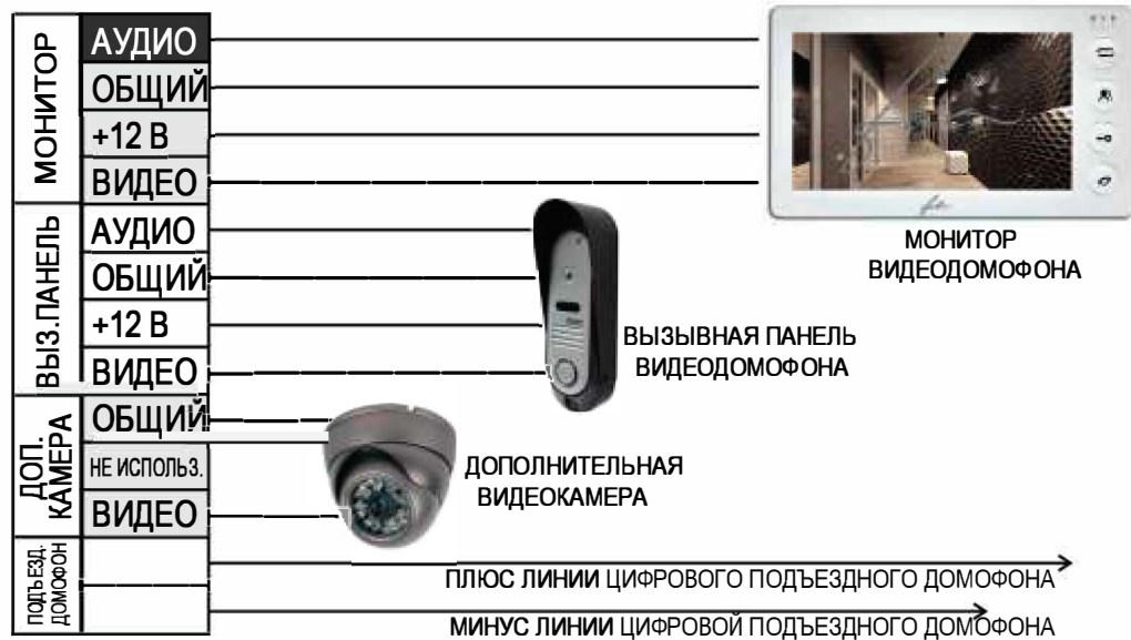
СХЕМА ПОДКЛЮЧЕНИЯ ПЛОСКОГО КАБЕЛЯ

Блок FX - VZ предназначен для совместного использования любой модели индивидуального видеодомофона таких марок, как FOX, COMMAX, HIPER, KOCOM, KENWEI, QUANTUM, FALCON EYE и т.п. с подъездным цифровым аудиодомофоном типа МАРШАЛ, LASKOMEX, RAIKMANN и т.п. Модуль позволяет подключить к одному из входов видеодомофона подъездную разговорную линию с видеокамерой и типовую видеодомофонную вызывную панель. Необходимый уровень звука для подъездного домофона устанавливается регуляторами громкости динамика и усиления микрофона.