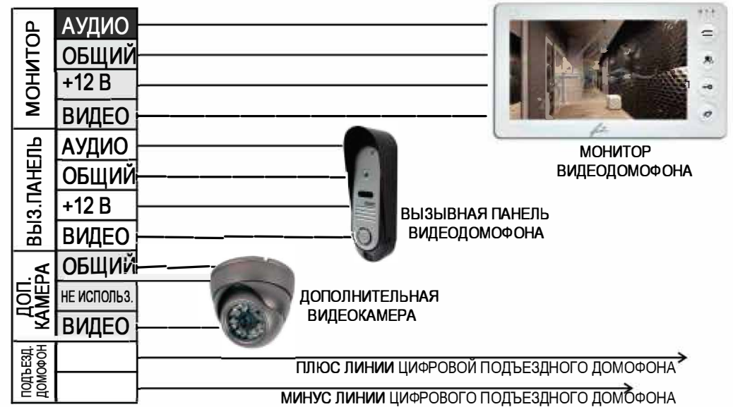
СХЕМА ПОДКЛЮЧЕНИЯ ПЛОСКОГО КАБЕЛЯ

Блок FX - VZ предназначен для совместного использования любой модели индивидуального видеодомофона таких марок, как FOX, COMMAX, HIPER, KOCOM, KENWEI, QUANTUM, FALCON EYE и т.п. с подъездным цифровым аудиодомофоном типа МАРШАЛ, LASKOMEX, RAIKMANN и т.п. Модуль позволяет подключить к одному из входов видеодомофона подъездную разговорную линию с видеокамерой и типовую видеодомофонную вызывную панель. Необходимый уровень звука для подъездного домофона устанавливается регуляторами громкости динамика и усиления микрофона.